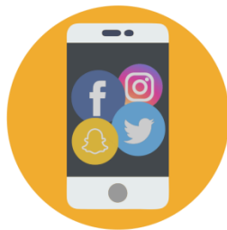
Usar redes sociales