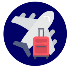
Viajar por placer

Entre otros están jugar videojuegos, leer libros impresos, ir a fiestas con amigos y practicar deportes. Estos hábitos son similares en América como en Perú.